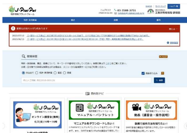
J-PlatPatのトップ画面 ( https://www.j-platpat.inpit.go.jp/ )

J-PlatPatの検索の経験が浅い方は、第2章、第3章の基本編、第6章の解説を参照しながら、実際に検索をしてみてください。